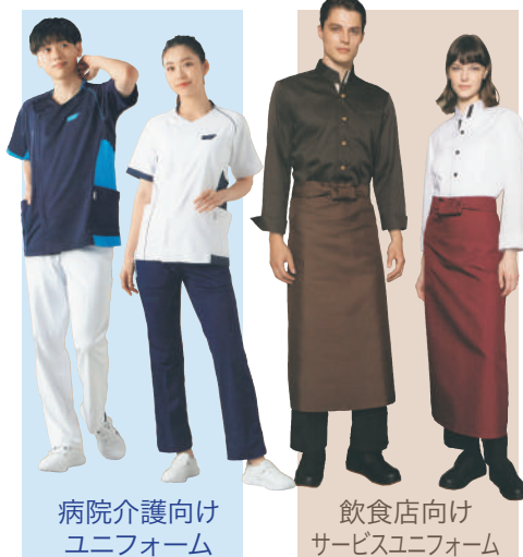
病院介護向け ユニフォーム

今後はあらゆる企業にも対応できる総合ユニフォーム企業として、今まで以上に皆様のお役に立てる企業を目指していきたいと思っておりますので、今後とも一層のご支援とご愛顧の程を宜しくお願いいたします。